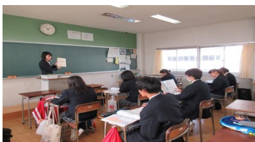
教育学・教員養成