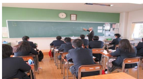
経済・経営・法律・政治