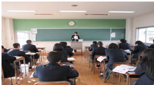
文学・語学・歴史学

12月5日(火)に1年生「産業社会と人間」の授業で進路分野別ガイダンスを実施しました。33の分野に分かれ、分野別に大学や短大、専門学校の方から説明をしていただきました。希望分野についての見識や理解が深まりました。