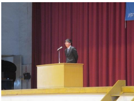
菊地先生「自分も頑張るのでみんなも頑張ってもらいたい」