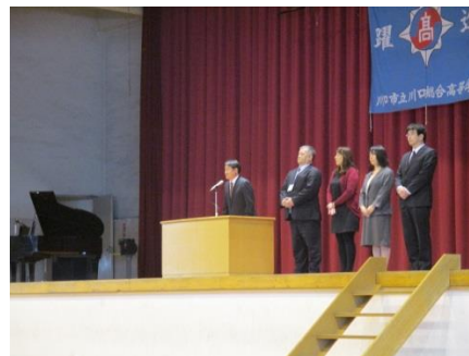
新校開設準備部会の挨拶