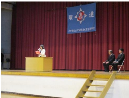
転退職の先生紹介