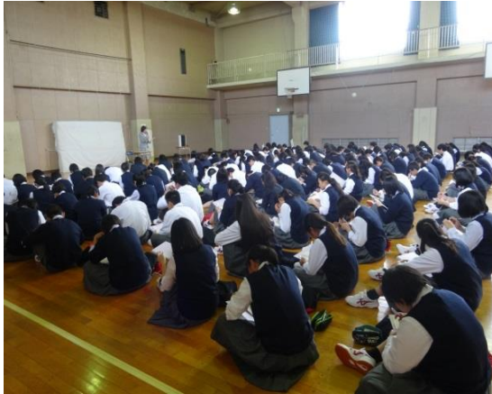
オリエンテーションの様子

4月18日(木)に1年生「産業社会と人間」の時間に進路オリエンテーションを行いました。進路指導主事の講話(中学と高校の違いや正社員と非正社員の違い等)の後、進路適性検査を実施しました。