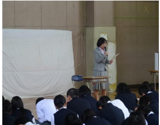
進路指導主事講話