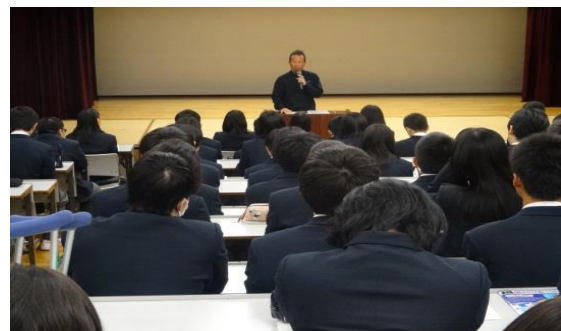
5教科担当教諭から