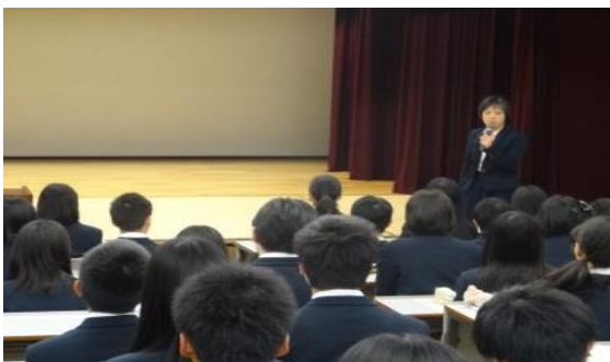
進路指導主事から