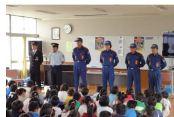
<消防団の出前授業>

ことを通して、「地域を支えてくれている人々」のことを理解できたことと思います。消防団の皆様ご多用の中ありがとうございました。